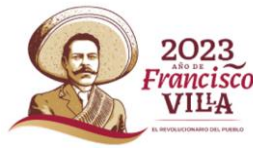
CUADRO - Otros elementos