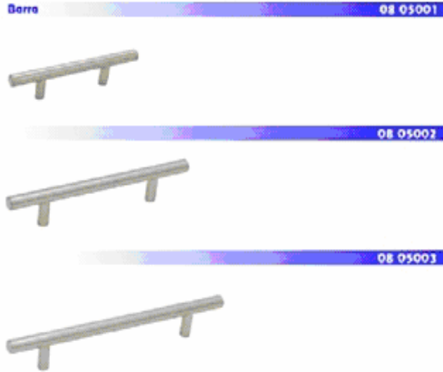
Ilustración 1. Jaladeras de acero

7. En el caso particular de las jaladeras de acero, son elaboradas a partir de acero redondo con cuerpo y patas de diámetro similares; por lo general, el cuerpo tiene un diámetro de 12, 14 o 16 milímetros (mm). Las medidas del cuerpo se determinan con base en la distancia entre centros más una variación de 30 mm a 60 mm, las medidas más comunes son 64; 96; 128; 160; 192; 224; 256; 288; 320; 352; 384; 416; 458; 480; 560; 640; 720; 800; 880; 960; 1,040 y 1,120, todas expresadas en mm, no obstante, existen medidas no convencionales de acuerdo con el productor, pero la altura es estándar (ver Ilustración 1).