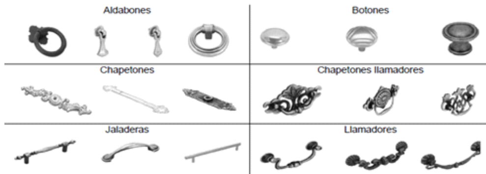
Ilustración 2. Jaladeras de zamac

9. Los tipos de jaladeras de zamac incluidos en la investigación son estrictamente jaladeras, botones, chapetones llamadores, llamadores, chapetones y aldabones, como los que se ejemplifican en la Ilustración 2.